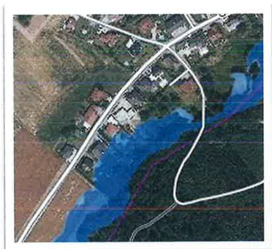
Auszug aus HORA

Bezugnehmend auf den betroffenen Teil des Hochwassrüberflutungsgebietes kann festgestellt werden, dass sich eine Teilfläche des gegenständlichen Grundstückes in der gelben Zone befindet. Nähere Erläuterungen dazu nachstehend: