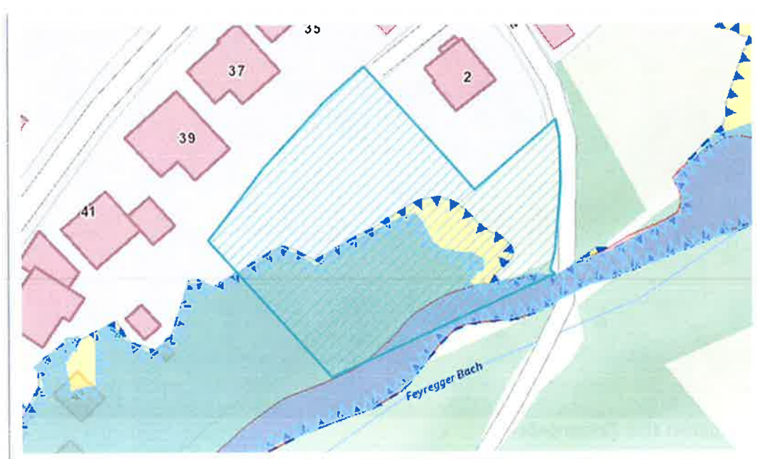
Auszug aus Doris