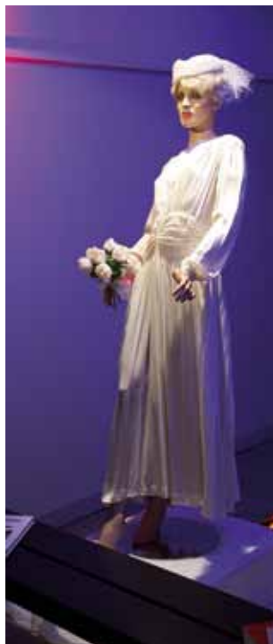
Das Brautkleid aus amerikanischer Fallschirmseide.

Bis April ist das Stadtmuseum geschlossen. Das Museumsteam arbeitet bereits an der nächsten Sonderausstellung im kommenden Jahr mit dem Thema „Mythos Kurpark“.