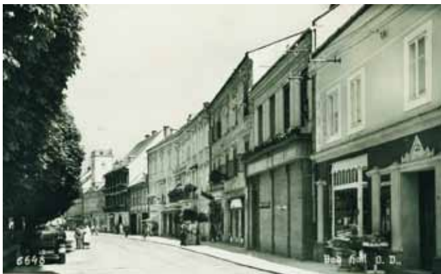
Ansicht des Hauptplatzes um 1935 als Ansichtskarte

Seine Nachkommen hatten nach dem Weltkrieg wieder als Fotografen auf Hauptplatz 19 gearbeitet. Charlotte Dopf übte von 1948 bis 1986 in diesen Räumen das Fotografenhandwerk „Fleischmann“ mit Handel aus.