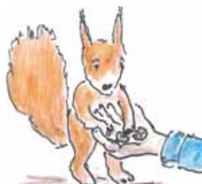
Illustrationen: Wolfgang Hingerl