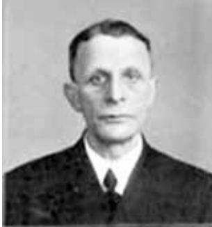
Michael Fleischmann auf der Gestapo-Akte Wien 1943

Der jüdische Fotograf Michael Fleischmann (1884–1943) hinterließ viele Fotos von Bad Hall in der Zwischenkriegszeit. So auch die alte Ansicht des Hauses Hauptplatz 19 mit einer kleinen Auslage vom Fotoatelier Fleischmann (aus dem Fotoarchiv des Stadtmuseums).