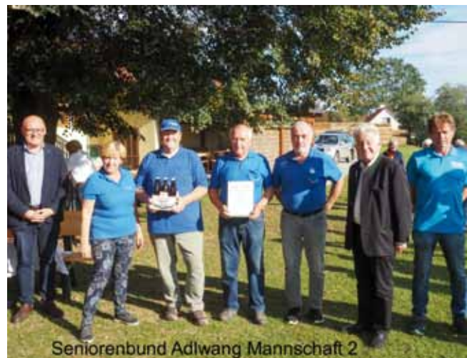
Seniorenbund Adlwang Mannschaft 2

haber holten den hervorragenden 8. Rang.