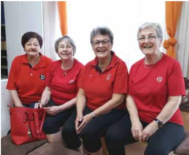
Die erfolgreichen Bad Haller Keglerinnen.

wieder einen sportlichen Erfolg erringen. Sie wurden Bezirksmeister im Damen-Mannschaftsbewerb. Auch im Einzelbewerb gab es sehr gute Platzierungen, es wurden die Plätze 2, 5, 8 und 12 belegt.