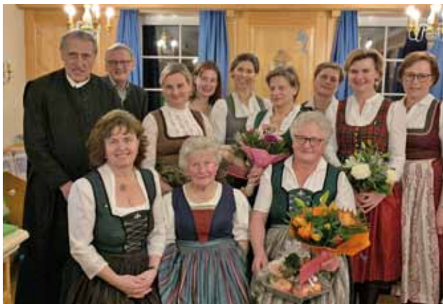
Danke für die langjährige Arbeit bei der Goldhaubengruppe!