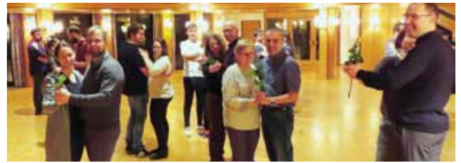
Die Teilnehmer am Anfängerkurs.