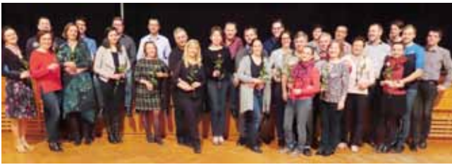
Die Teilnehmer am Kurs für Fortgeschrittene.

Ein wahrer Allrounder also, initiiert von der Gesunden Gemeinde Adlwang.