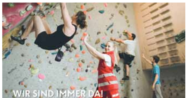
Gutes tun beim Roten Kreuz – Zivildienst, Berufsfindungspraktikum oder bei einem Freiwilliges Sozialjahr.

Rettungskommandant für das Rote Kreuz Steyr-Land.