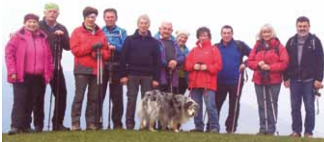
Wanderhit Grillparz im Frühling 2019

Änderungen vorbehalten. Gerti und Sepp Heinzelmann, Tel. 07258/7595, Franz Maier, 07258/2868, oder Gerhard Schütz, 0650/30 120 41, nehmen gerne Anmeldungen entgegen und geben weitere Informationen, oder falls witterungsbedingt Termine verlegt werden. Startpunkt für die Fahrgemeinschaften ist jeweils der Parkplatz in Pfarrkirchen.