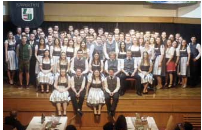
Die Landjugend freut sich auf ein weiteres erfolgreiches Jahr.