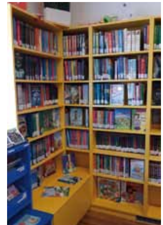
Der neu gestaltete Kinderbuchbereich

Weitere Informationen gibt es auf der Homepage oder auf der Facebook Seite.