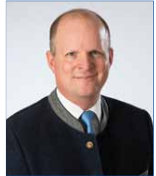
Liebe Bad Hallerinnen und Bad Haller