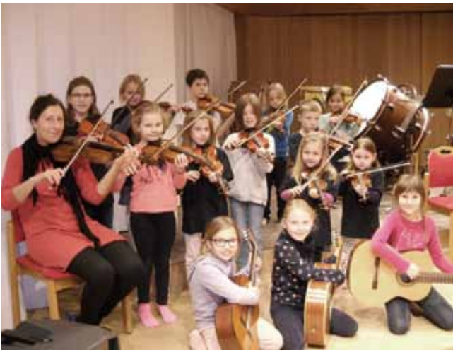
„Die Kleinen Künstler“ bei einer Probe.

Nach dem Konzert gibt es die Möglichkeit, im Foyer die einzelnen Instrumente zu probieren.