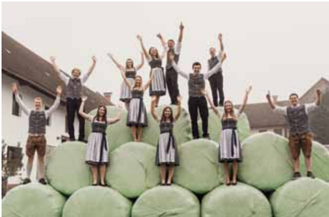
Das Vorstandsteam in der neuen Landjugend-Tracht.