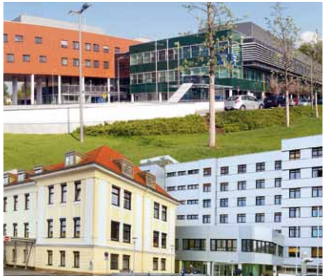
Das Pyhrn-Eisenwurzen-Klinikum Kirchdorf Steyr garantiert medizinische Vollversorgung.

Für angehende Medizinerinnen und Mediziner bietet das Pyhrn-Eisenwurzen Klinikum ebenfalls viele Vorteile. Weite Teile der Ausbildung können jetzt künftig unter einem Dach absolviert werden.