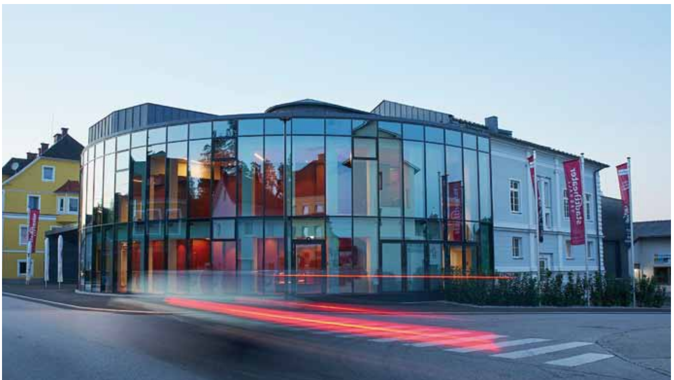
Harmonisch fügen sich das großzügige Foyer und die neue Fassade ins Stadtbild ein