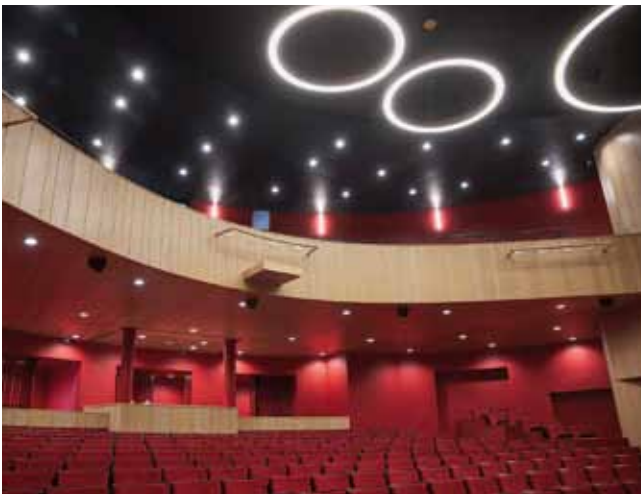
Einzigartige Ambiente mit bequemen Sitzen und stimmungsvoller Beleuchtung

Viele Gründe um sich auf die Vorstellungen und das neue Ambiente im vollklimatisierten Stadttheater Bad Hall zu freuen.