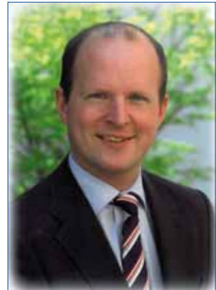
Liebe Bad Hallerinnen, liebe Bad Haller

Deshalb werden Ehepaare, die 2019 ein Jubiläum feiern, gebeten, zwei Monate vor dem Jubiläum persönlich oder telefonisch im Stadtamt (Sekretariat, 1. Stock, Fr. Derflinger, Tel.: 07258/7755-24) mitzuteilen, ob sie einen Besuch bzw. die Urkunde wünschen.