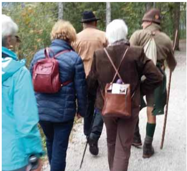
Wanderung im Almtal mit dem Förster