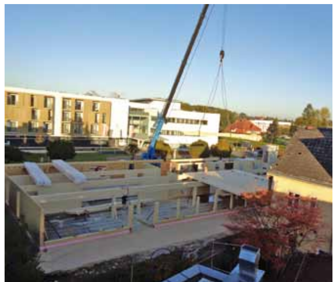
Das Erdgeschoss beim Kindergarten-Neubau wurde bereits errichtet.

Dieses fachliche Hintergrundwissen unterstützt das Team wesentlich bei der Arbeit mit den Kindern.