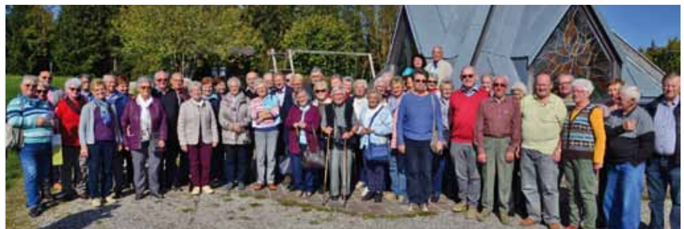
Die Senioren beim Besuch des Kraftplatzes in St. Georgen in der Klaus.

Die Verkostung der auf dem Hof hergestellten Käsesorten fand bei den Teilnehmern großen Anklang.