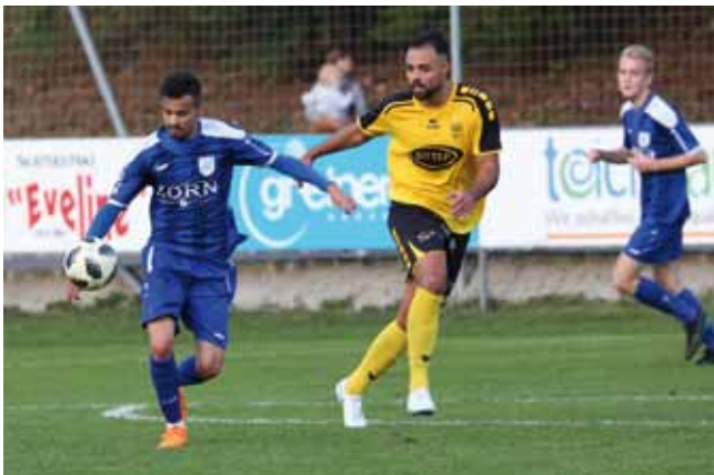
Spielszenen vom Derby gegen Sierning vor 550 Zuschauern.