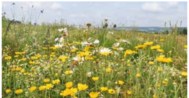
Blühflächen bringen für die blütenbestäubenden Insekten und Bienen hochwertigen Nektar und Pollen.

Wie in den vergangenen Jahren kann die Anlage von Blühflächen der Maschinenring übernehmen, oder man besorgt sich das Saatgut beim Maschinenring und gestaltet die Anlage selber.