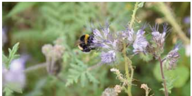
Auf den Blühflächen fühlen sich auch die Hummeln wohl.