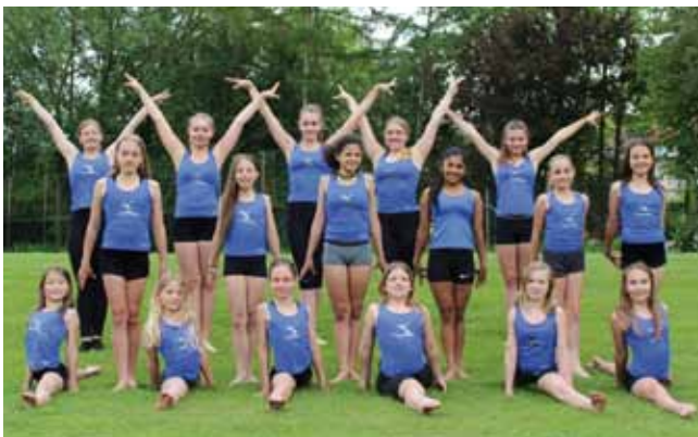
Das Archivfoto entstand noch vor Corona.

Die Turnerinnen und Trainerinnen hoffen damit etwas Abwechslung und vor allem Freude zu schenken. Besonders in der derzeitigen Distanziertheit ist dieser Zusammenhalt etwas ganz Besonderes.