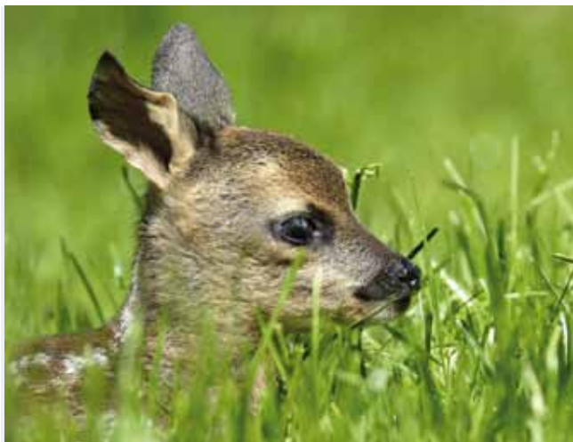
Die erfolgreiche Zusammenarbeit zwischen der Jägerschaft und den Landwirten rettet jährlich zahlreiche Jungtiere.