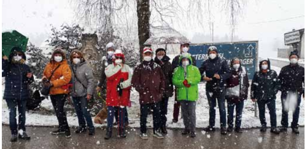
Die wetterfesten Pfarrkirchner Pensionisten bei der Wanderung am 18. März.

nur mit vier Personen gestattet. Groß ist die Sehnsucht nach weiteren geselligen Zusammenkünften. schönen Ausflügen und