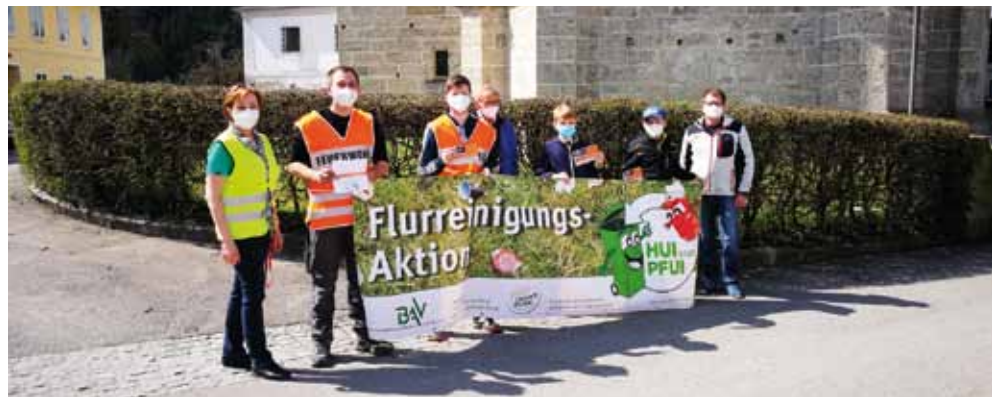
Die Gewinner mit Vertretern der Gemeinde.

Ein großer Dank seitens der Gemeindevertretung auch an alle BürgerInnen, die das ganze Jahr über, ohne viel Aufhebens und von sich aus, dieser lobenswerten Tätigkeit nachgehen.