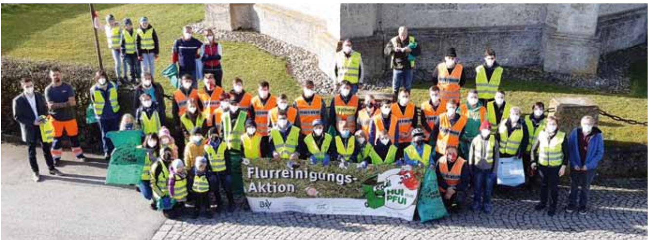
50 fleißige Helfer sammelten jede Menge Müll bei der Flurreinigungsaktion.