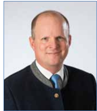
Liebe Bad Hallerinnen und Bad Haller

Die Arbeiten für die Asphaltierung der Höllhuber-, Sperling- und Habichtstraße wurden an die Fa. Porr, Linz, mit einem Auftragsvolumen von netto € 220.000,- vergeben. Für den Ausbau der Parkstraße und Brucknerstraße wurden € 450.000,- veranschlagt und bewilligt. Davon werden € 200.000,- aus dem KIP (Kommunales Investitionsprogramm) des Bundes finanziert.