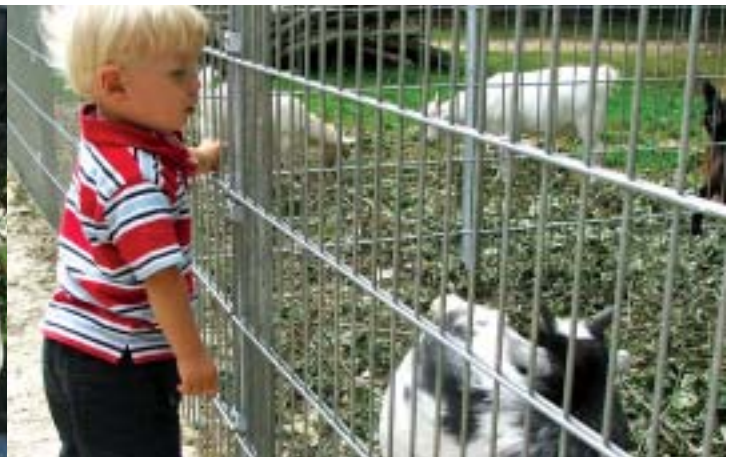
Kinder und Tiere verstanden sich immer.