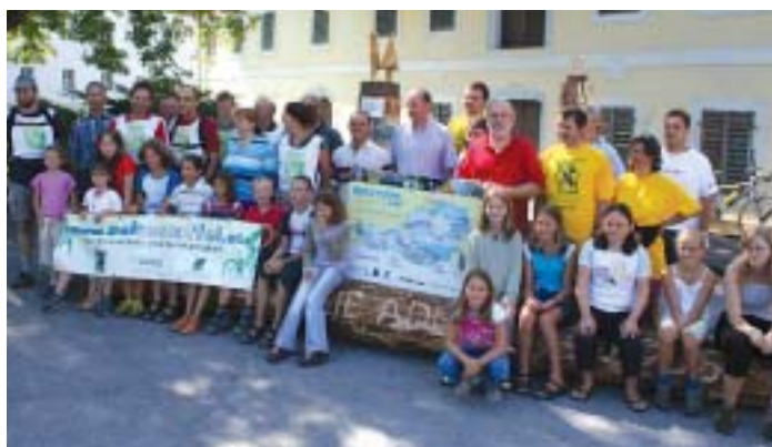
„Großer Bahnhof“ für die Ökostaffel.

„Garniert“ wurde alles von einem Büffet mit Bioprodukten aus heimischen Betrieben. Von jeder Etappen-Gruppe wird ein Rucksack mit Fairtrade-Produkten und ein „Botschaftsbuch für die nächste Generation“ an die jeweils folgende Gemeinde weitergegeben. Adlwang war die letzte Sta-