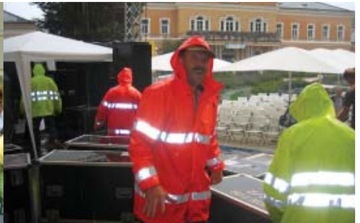
Abends musste der Bauhof bei strömendem Regen abbauen.