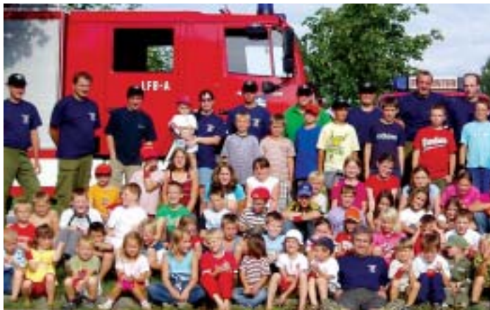
Großer Andrang beim „Tag der Feuerwehr“.