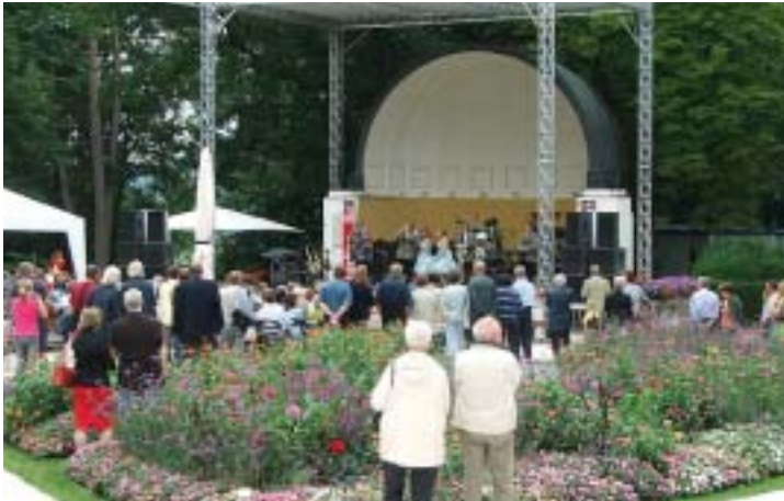
Begeisterte Zuschauer bei den Motorbienen.