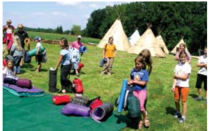
„Erlebnis Natur“ gab es für die Kinder.

Bei so einem Unternehmen müssen natürlich viele von der Zivilisation verdeckte Fertigkeiten, wie Lagerfeuer machen, Brücke bauen, Stöcke schnitzen oder im Bach waschen, neu „entdeckt“ werden. Für Unterhaltung sorgte nicht der Fernseher oder ein Computerspiel, sondern nur die eigene Phantasie. Wirklich nachhaltig und