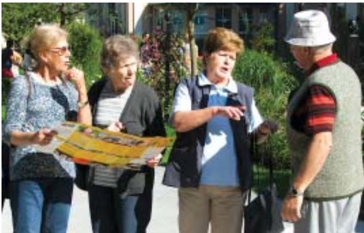
Wo gehen wir hin – eine häufige Frage der Besucher.