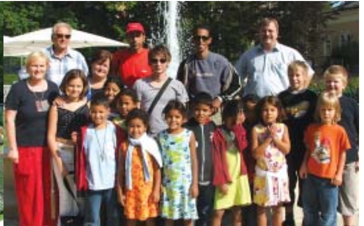
Kinder aus der Westsahara waren begeistert.