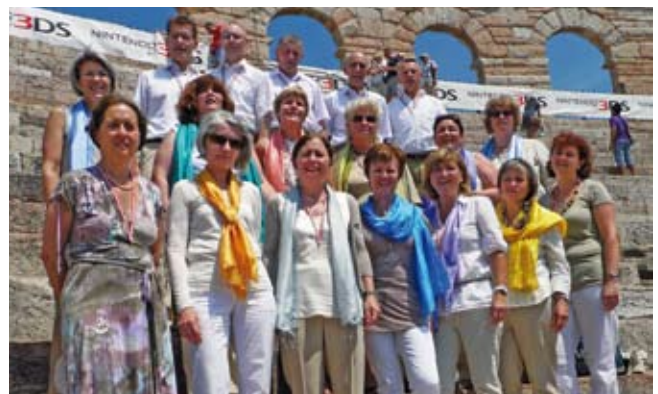
Die Chorgemeinschaft Bad Hall in der Arena von Verona.

Die Proben beginnen am Montag, 10. September um 19:30 Uhr in der Landesmusikschule Bad Hall.