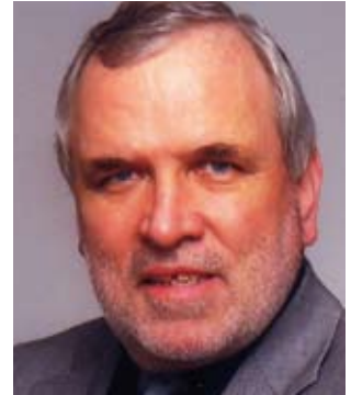
Geschätzte Adlwangerinnen, geschätzte Adlwanger!

Die Veranstalter hoffen, dass sich die Jugend daran eifrig beteiligt.