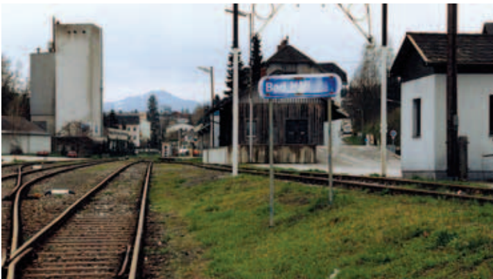
Seit rund 100 Jahren gehörte das Magazin zum Bad Haller Bahnhof. Am 28. November wurde es abgerissen.