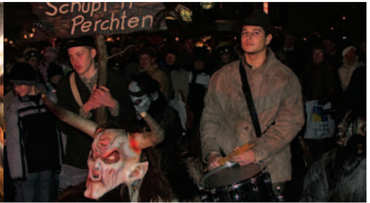
... Perchten bevölkerten den Hauptplatz ...