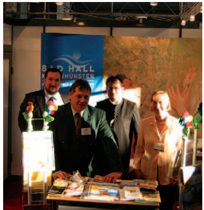
Fixtermin für die Werbung ist die Seniorenmesse in Wien.

27. – 30. Dezember und 2. – 5. Januar 08:00 – 16:30 durchgehend und 25. + 26. Dezember sowie 1. + 6. Januar geschlossen.