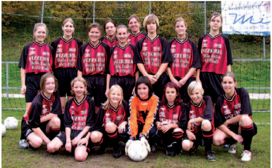
Nun heimsen die Bad Haller Fußballdamen Erfolge ein.

Zweimal in der Woche fand das Training bei jeder Witterung statt. Nach ca. 3 Monaten gab es bereits die ersten Testspiele gegen andere Damenmannschaf-