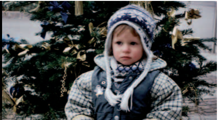
... und die Kinder warteten auf das Christkind.