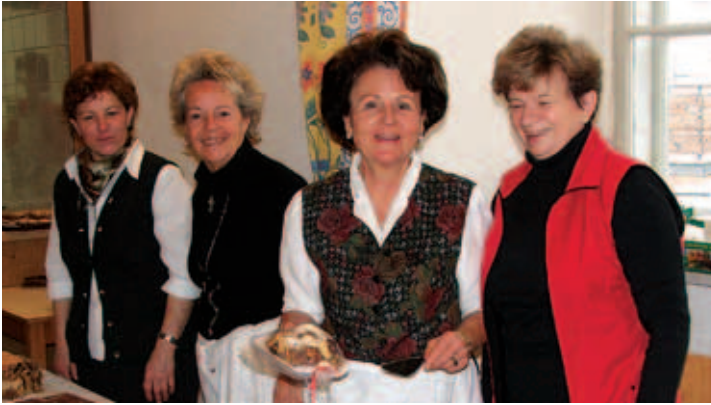
Bunt zeigte sich der Advent: „Das Pfarrcafe lud ein ...“