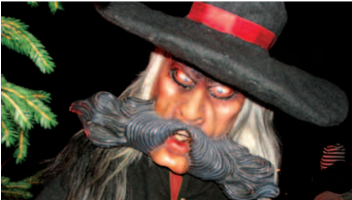
... seltsame Gestalten erstaunten die Besucher ...