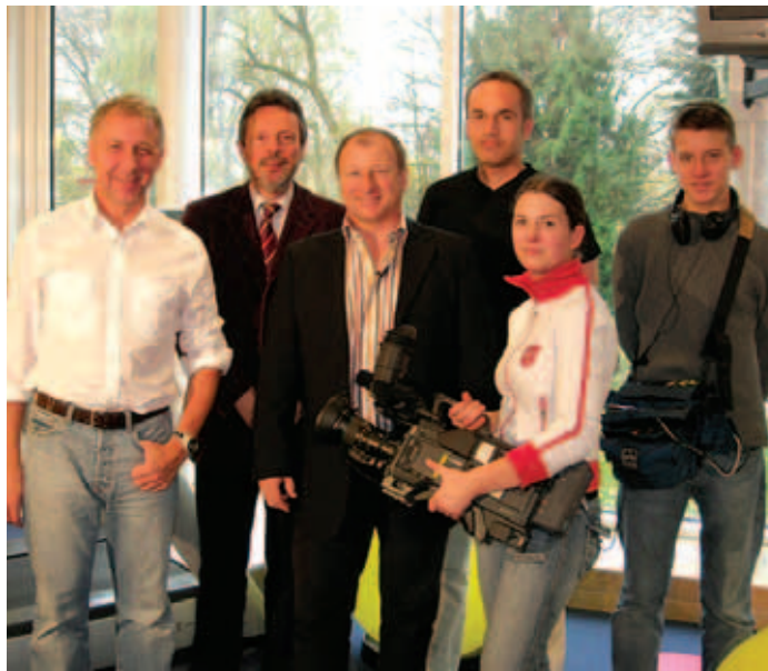
In TW1 sind die Werbespots für die Region zu sehen.

Schon zur angenehmen Gewohnheit werden die Aufenthalte von TV Star Harry Prünster in unserer Region. Für neue Fernsehspots weilte der sympathische Tiroler für 24 Stunden in Bad Hall und Kremsmünster. Die Beiträge in TW 1 erfreuen sich bei den Sehern großer Beliebtheit und haben auch einen hohen Werbewert. Diesmal wurden mit Harry Prünster im Stift Kremsmünster und bei den Tassi-