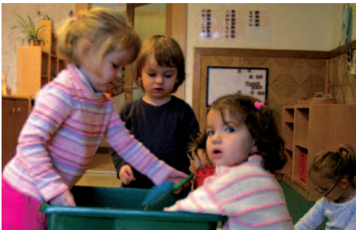
Auch die Kleinsten fühlen sich wohl im Kindergarten.