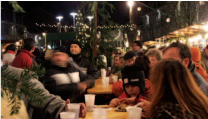
... die Weihnachtsmärkte waren Treffpunkt ...