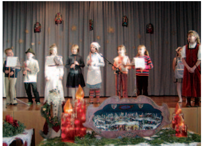
Auch die Kinder machten mit.

Die Verkaufsbuchausstellung bot wiederum einen Querschnitt durch die Kinder- und Jugendbücher und die Erwachsenenliteratur erstreckte sich von Kochbüchern, Gesundheitsbüchern, bis zu Werken der Weltliteratur und der Belletristik. 10% des Verkaufserlöses erhält die Volksschule und es werden damit neue