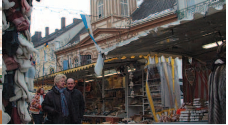
... der Katharinenmarkt lockte Besucher an ...