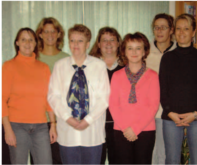
Der neue Vorstand des Elternvereines der Volksschule.