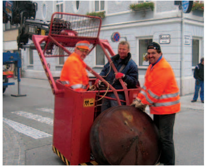
Mitarbeiter des Wirtschaftshofs und der Firma Hagendorfer nach der Demontage der Sirene vom Hauptplatz, die noch aus der Mitte des vorigen Jahrhunderts stammt.

So bieten die neuen Sirenenstandorte auf der Landesmusikschule und bei der Firma agru in der Grünburger Straße nun auch für diese Stadtteile die Gewissheit diese Warnungen auch tatsächlich zu hören. Der vorgegebene äußerst straffe Zeitplan beim Umbau selbst konnte nur dank der Zusammenarbeit aller Beteiligten eingehalten werden. Hier ist vor allem den Wirtschaftshofmitarbeitern und auch den Feuerwehrkameraden für die Arbeiten in den Feuerwehrhäusern Bad Hall und Hehenberg zu danken.