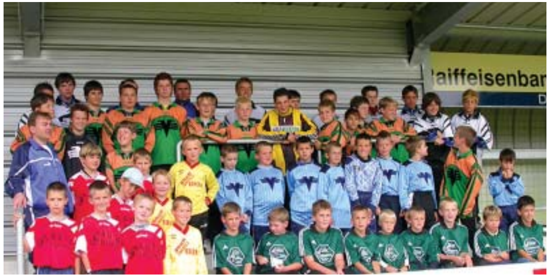
Nachwuchs gesichert – Betreuer gesucht.

Die sportlichen Erfolge können aber nicht darüber hinwegtäuschen, dass es immer schwieriger wird, Fußball begeisterte Personen zu finden, die bereit sind ihre Freizeit in den Dienst der Jugend zu stel-