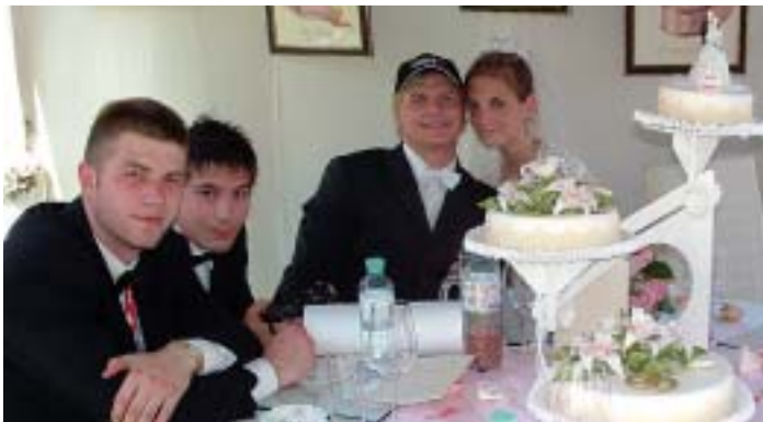
... sogar ein Hochzeitspaar hatte sich eingefunden.