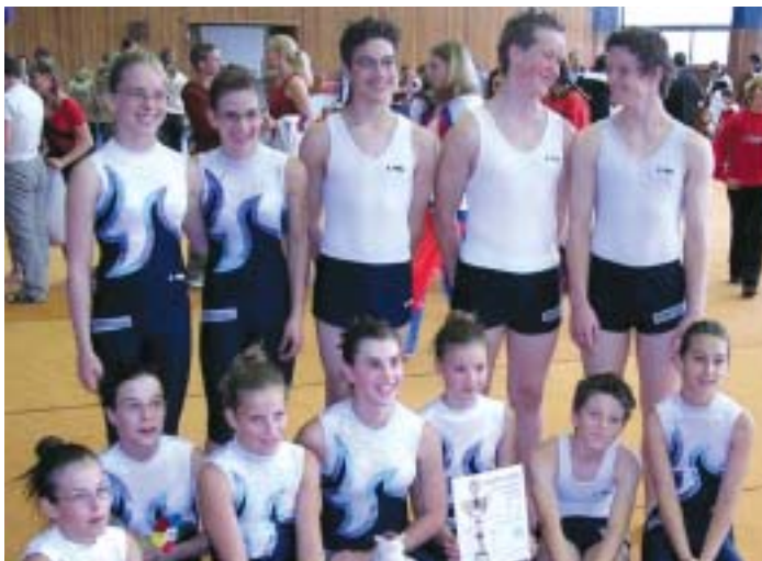
Erfolgreich in Brünn: Die Bad Haller Teamturner.

Weitere aktuelle Infos unter www.turnverein-bad-hall.at