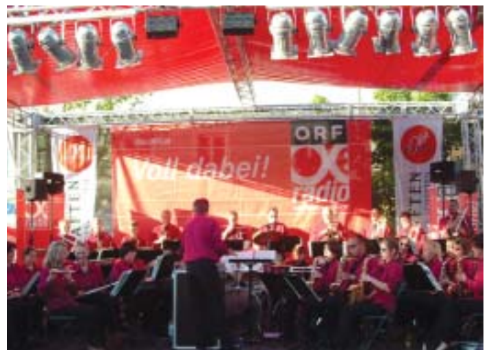
Das X-Large-Konzert am Hauptplatz begeisterte die Freunde der Blasmusik (li) und die ÖTB-Big-Band (re) ist längst zum fixen Bestandteil im Musikgeschehen geworden.