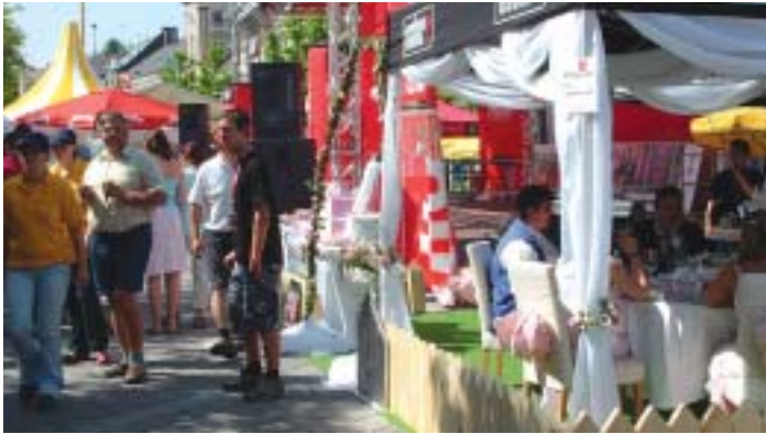
Das große Grillfest lockte zahlreiche Besucher an ...