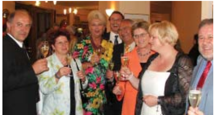
Ein „Prost“ auf den „Vogelhändler“