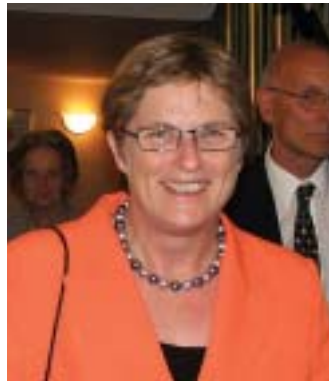
Ministerin Ursula Haubner