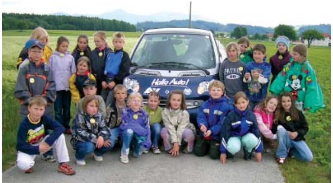
Dass Kollisionen gefährlich sein können, erfuhren die Schüler bei „Hallo Auto“.

In dieser Hinsicht erlebten die Schüler der 3. Klasse der Volksschule Adlwang praktischen Verkehrserziehungsunterricht. Wie sich Masse und Geschwindigkeit eines sich bewegenden Körpers auf seinen Anhalteweg auswirken, erprobten die Schüler spielerisch, doch auf beeindruckende Weise durch Laufen und abruptes Stoppen. Dabei konnten sie beobachten, dass eine nasse Fahrbahn den Bremsweg erheblich