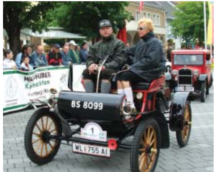
Bei der Oldtimer-Rallye des Lions-Clubs kamen die Oldie-Fans auf ihre Rechnung.