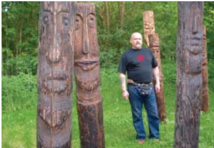
Künstler vom Rand der Gesellschaft.