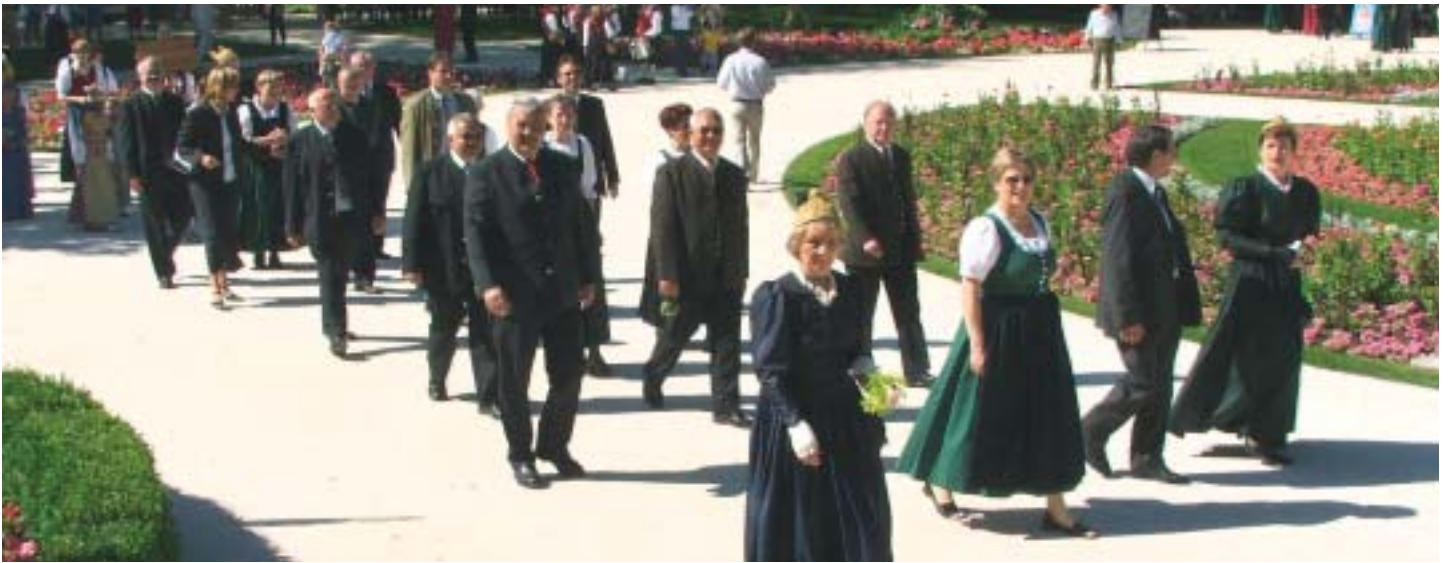
Zu einem farbenfrohen Fest wurde der „Trachtensonntag im Park“ am 19. Juni.