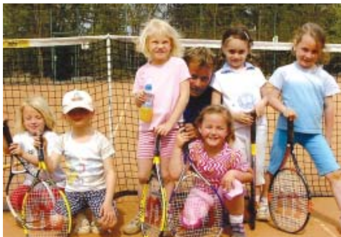
Tennis-Spaß auch für die Kleinen.

Unter den Mitgliedern des Vereins wird jeden Freitag ab 18 Uhr ein Team Cup ausgetragen. Zuschauer sind herzlich willkommen.