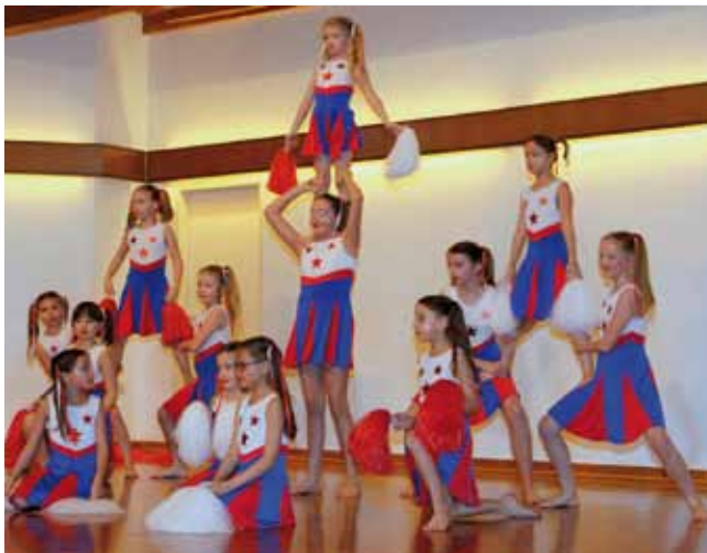
Freude an der Bewegung und Gemeinschaft erleben.