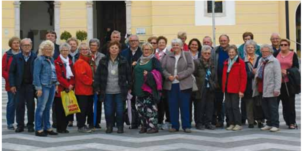
Die Adlwanger Pensionisten vor der Mondseer Kirche.

Am 17. Mai fuhren die Adlwanger Pensionisten nach Salzburg zur Besichtigung der Fa. Wenatex. Hier erfuhren sie in einem interessanten Vortrag viel über gesunden Schlaf. Anschließend ging es weiter nach Mondsee. Nach einer einstündigen Schiffsrundfahrt ging es mit dem Bummelzug in den Ort. Dort gab ausführliche Informationen über die wunderschöne Kirche und den Ort Mondsee.