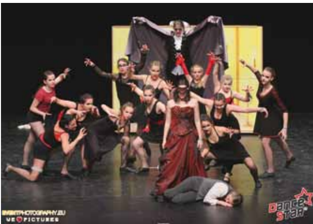
Das harte Training wurde mit dem 1. Platz bei den World Dance Masters belohnt.

Über einen sensationellen 1. Platz für die dance work Company, einen 3. Platz für die Showdance Kids und über viele weitere Platzierungen freuen sich die Teilnehmer bereits aufs nächste Jahr.