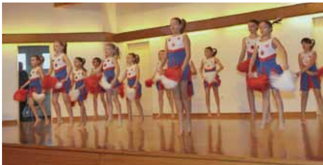
Tanzen und Musik bringt Körper, Geist und Seele in Einklang.

Höhepunkt war die Auf- führung beim Internationalen Jugendturnier mit über 1000 begeisterten Zuschauern. Die anspruchsvolle Choreographie der Tänzerinnen begeisterte.