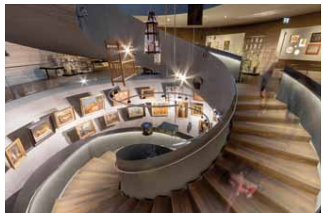
Das Paneum in Asten.

Gelegenheit auf eine interessante Ausflugsfahrt mit zwei attraktiven Zielen!