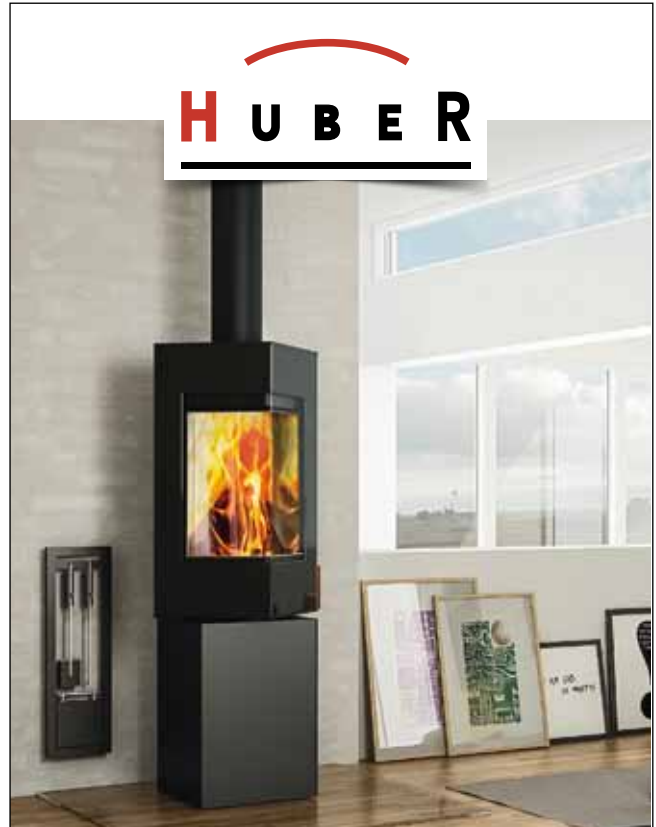
HUBER KACHELÖFEN & FLIESEN Hauptstraße 28, Kremsmünster E office@huber-keramik.at, T 07583 84 06-0, www.ofendesign.at