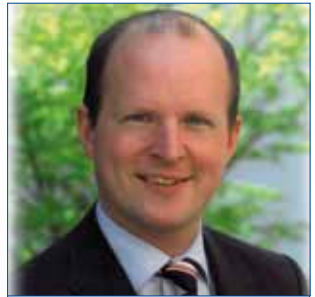
Liebe Bad Hallerinnen, liebe Bad Haller

Die Straßenmeisterei Kremsmünster ersucht um Verständnis, dass es dadurch zu Behinderungen und Einschränkungen kommt.