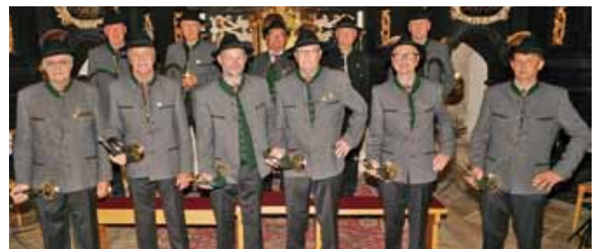
Die Jagdhornbläsergruppe St. Blasien

Kammerhuber. Im Anschluss gab es vor der Kirche eine Agape. Am Abend blies die Jagdhorngruppe auch bei der traditionellen Maiandacht beim Heiligen Brunnen in Adlwang.