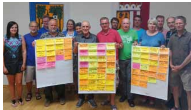
14 motivierte Bürgerinnen und Bürger analysierten die gegenwärtige Radverkehrssituation in der Stadt.

nicht nur ein Verkehrsthema, sondern auch ein Umwelt-, Gesundheits-, Wirtschafts-, Raumordnungs- und Wohnbauthema. Als Ergebnis wird ein konkreter Umsetzungsplan mit Maßnahmen erarbeitet.