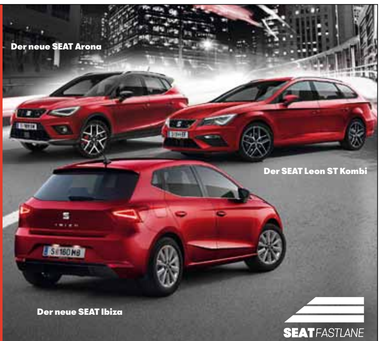
Der neue SEAT Arona