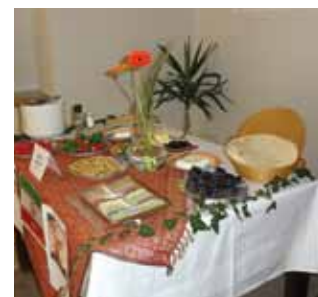
Gesucht werden Lieblingsrezepte für die internationale Gemüseküche.

Auskunft zum Wettbewerb (Tel.: 0676/59 585 85). Näheres zum Wettbewerb und zu den Einreichunterlagen auch unter www.daxanbau.at .