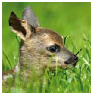
Jungtiere und Gelege (Nester mit Eiern) auf keinen Fall berühren. Es handelt sich um keine Findelkinder und die Eltern sind meist nicht weit von ihren Schützlingen entfernt.

ihnen die Zeit auch während des Tages, bleiben wir auf den Wegen und erfreuen wir uns am Anblick und