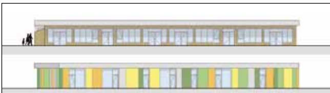
Planansicht vom Hort

unmittelbar angrenzende Turnsaal der Volksschule verwendet. Zusätzlich noch erforderliche Räume wie Leiterzimmer, Personalräume, Garderoben, WC-Anlagen, etc.