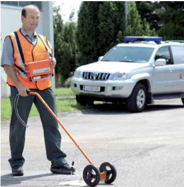
Die Trasse wird mit dem Gasspürgerät abgegangen und dabei auf volle Funktionstüchtigkeit geprüft.

Die damit beauftragten Spezialisten der Netz OÖ weisen sich auf Verlangen selbstverständlich aus. Die Gebäude bleiben von der Begehung unberührt. Für die Wartungen der Erdgasleitungen im Haus ist der Eigentümer verantwortlich.