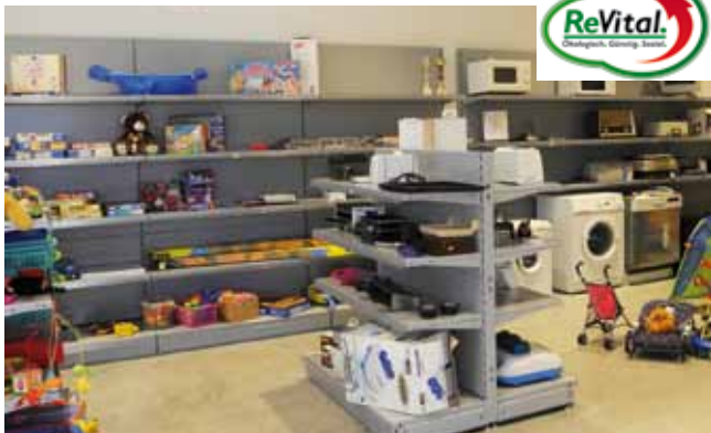
Im ReVital-Shop Steyr werden die qualitätsgeprüften Waren zum Verkauf angeboten.

Die „revitalisierten“ Waren werden im Volkshilfe-Shop Steyr in der Schönauer Straße 3 zu extrem günstigen Preisen zum Kauf angeboten. Öffnungszeiten sind von Montag bis Freitag von 9:00 bis 17:00 Uhr.