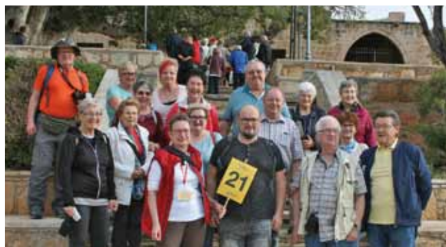
Mitglieder der Ortsgruppe nahmen am Frühjahrstreffen von Senioren Reisen auf der Insel Zypern teil. Die schönen Ausflüge und der traumhafte Frühling auf der Mittelmeerinsel hinterließen bleibende Eindrücke

Abfahrt 8:50 Uhr. Anmeldungen bei Renate Hipfinger Tel.: 2437 und 0676/72 555 10 oder bei SAB Tours.