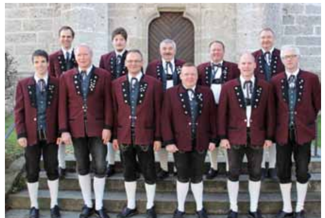
Die Mitglieder der Sängerrunde Adlwang freuen sich auf zahlreiche Besucher.

Auf jede Dame wartet eine kleine Überraschung!