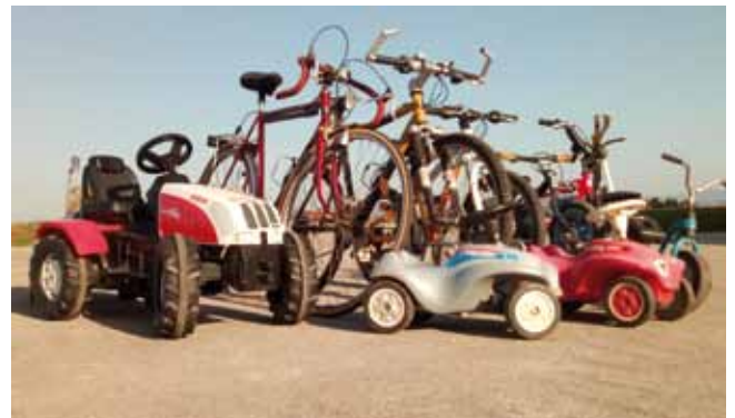
Rad-Basar für gebrauchte Fahrräder, Anhänger und Kinderfahrzeuge

Veranstalter ist der Arbeitskreis Klimaschutz Bad Hall in Zusammenarbeit mit der Stadtgemeinde.