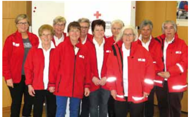
Das Team des Besuchsdienstes im Kurbezirk Bad Hall freut sich über Besuchsdienstanfragen.

Auch die Tagesbetreuung bietet jeden Mittwoch die Möglichkeit, einen Tag in der Begleitung von Rotkreuz-Mitarbeitern zu verbringen. Nähere Informationen und die Möglichkeit zur Anmeldung gibt es unter der Telefonnummer 0664/88 74 58 64.