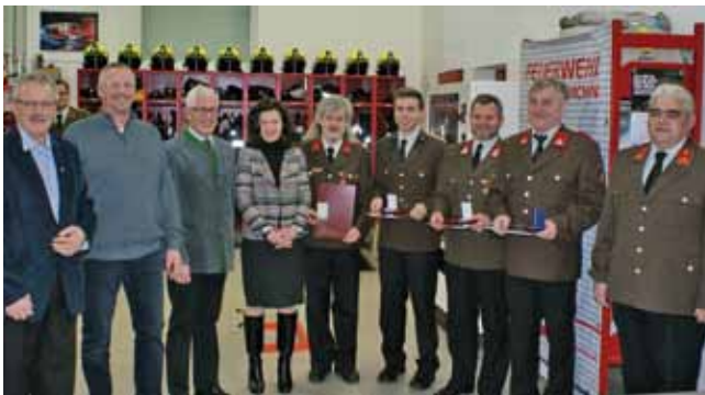
FF Pfarrkirchen - Ehrenzeichen der Gemeinde