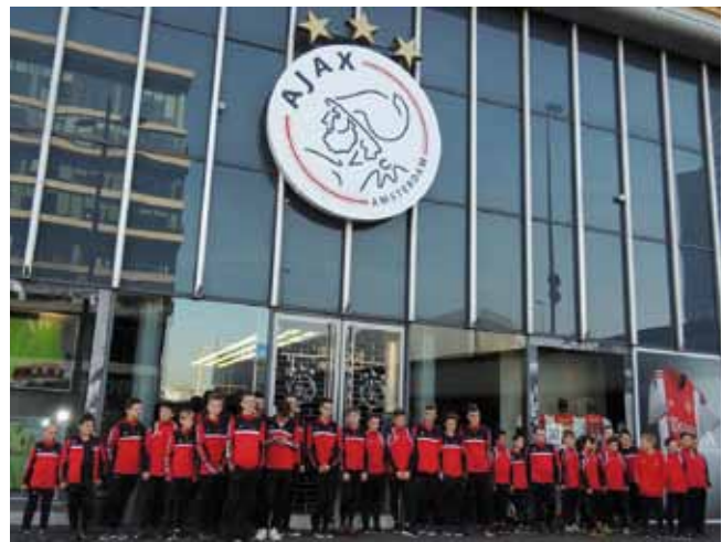
Jugendmannschaft beim „Internationalen Nachwuchsturnier 2016“ vor dem Stadion von Ajax Amsterdam.

Veranstalter ( http://www.turnierkreis.at/ ), aber auch für die gesamte Region ein Großereignis, das zeigt wie Fußball Menschen aus unterschiedlichsten Ländern Europas zusammenbringen kann.