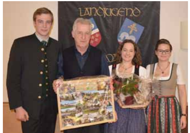
Dank an die Musikkapelle Adlwang