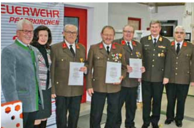
FF Pfarrkirchen - Ehrung für 50-jährige Mitgliedschaft