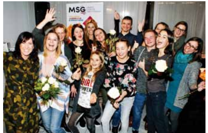
Die Sängerinnen und Sänger präsentierten Highlights aus Jazz/Pop/Rock.

Nähere Informationen zum Unterrichtsangebot der Musikschule Gattermann gibt es unter: www.musikschulegattermann.at .