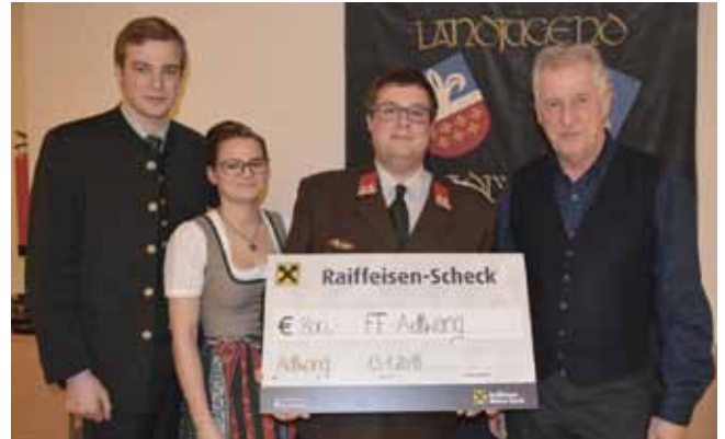
Spende an die Freiwillige Feuerwehr Adlwang

der Musikkapelle Adlwang für die großartige Zusammenarbeit beim MusiForst Fest jeweils mit einem Spendenscheck.