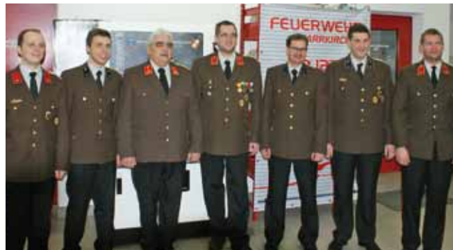
FF Pfarrkirchen - Kommando bestätigt