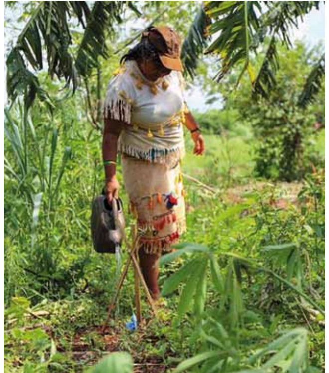
Frau der Guarani beim Gießen von Setzlingen

Eine Kooperationsveranstaltung des Fachausschusses für Schöpfungsverantwortung und des Kath. Bildungswerkes Adlwang