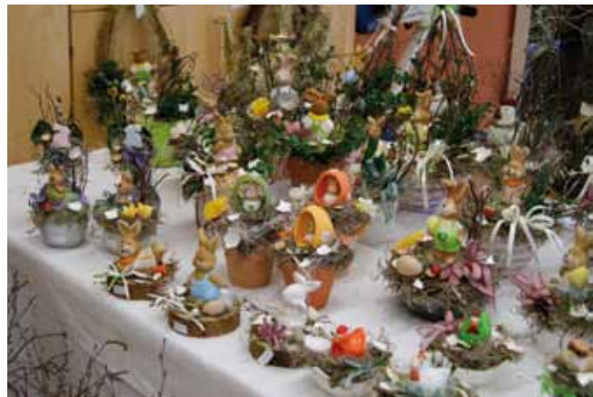
Schöne Geschenkideen erwarten die Besucher am Ostermarkt der Werkstätte Bad Hall.

Freitag, 9. März, 18:00 bis 22:00 Uhr, Samstag, 10. März, 10:00 bis 18:00 Uhr.