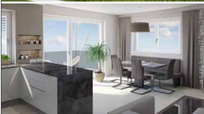
Haus C HWS, 22 KM/Min. (GEE 047)