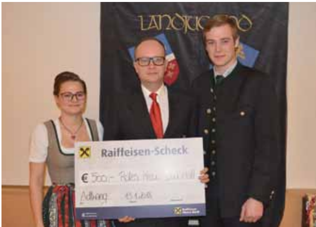
Spende an das Rote Kreuz Bad Hall