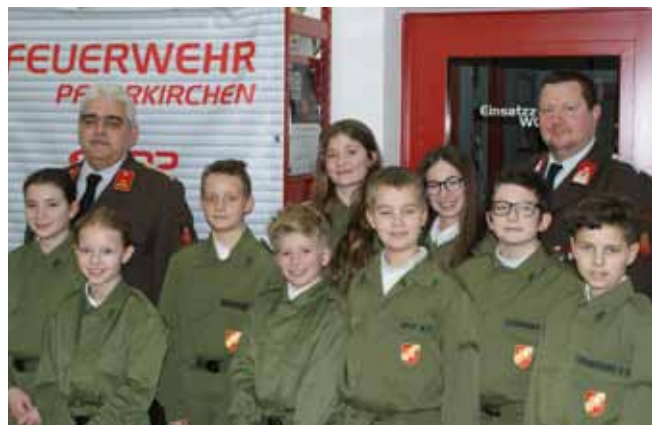
FF Pfarrkirchen - Angelobung der Jugend