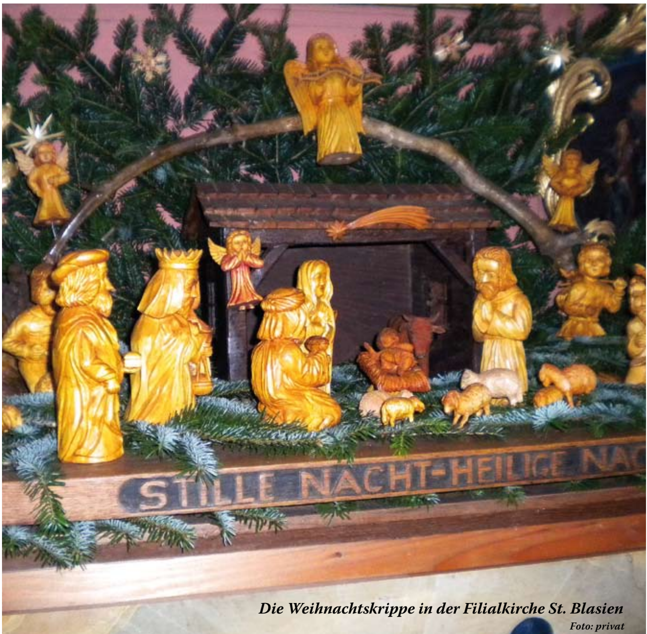
Die Weihnachtskrippe in der Filialkirche St. Blasien