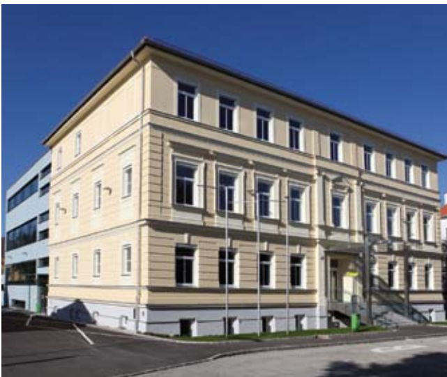
Modern und zeitgemäß präsentiert sich die Volksschule 2013.

Neun Klassenzimmer, zwei Ausweichklassen, großzügige Pausenräume, eine moderne Bibliothek und Gruppenräume werden die professionelle Ausbildung zukünftiger Schüler-Generationen wesentlich unterstützen. Die Stadtgemeinde hat mit der zeitgemäßen technischen Ausstattung der Klassenräume einen wertvollen Beitrag für neue Unterrichtsformen geleistet.