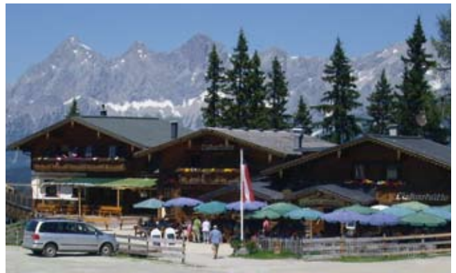
Die herrliche Natur-Landschaft beim Almgasthof Eiskarhütte.

landschaft wurde auf 1700 m Höhe bei einer Wanderung am Eiskar-Panoramasteig genossen. Bei herrlichem Wetter spiegelte sich das Dachsteinmassiv im Gasselsee. Beim Zottelsbergwirt in Spital fand die Fahrt ihren Ausklang.