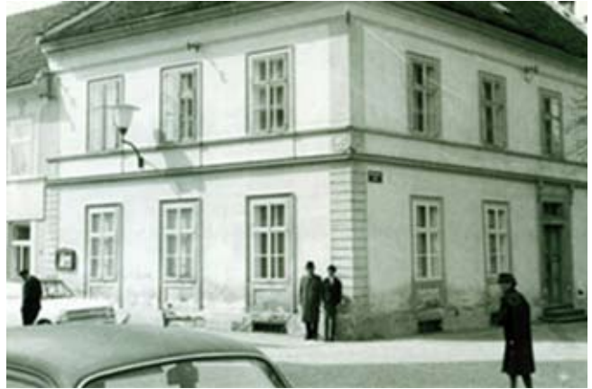
Das alte Schulhaus am Kirchenplatz.

Das Schulwesen wurde durch das „Reichsvolksschulgesetz“ von 1869 auf eine einheitliche Grundlage in der ganzen Monarchie gestellt und die Schulpflicht auf acht Jahre verlängert. Die Klassengröße wurde auf 80 (!) Schüler begrenzt und die Aufsichtspflicht dem Staat – nicht mehr der Kirche – unterstellt. Das Schulunterrichtsgesetz von 1962 verlängerte die Schulpflicht auf neun Jahre. Die Einführung der Koedukation erfolgte 1975. Derzeit wird das Modell Gesamtschule der 10 bis 14jährigen politisch heiß diskutiert.